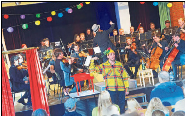
Klassik, Spaß und Unterhaltung: Ein buntes Programm bietet das Detmolder Kammerorchester.