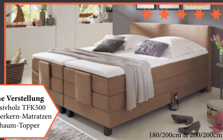
180/200cm & 200/200cm

motorische Verstellung Boxen Massivholz TFK500 Taschenfederkern-Matratzen 4cm Kaltschaum-Topper