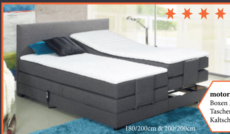
180/200cm & 200/200cm

motorische Verstellung Boxen Massivholz Taschenfederkern-Matratzen Kaltschaum-Topper 1.999,-