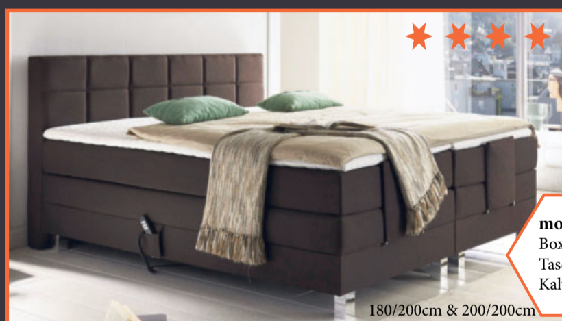
180/200cm & 200/200cm

WSV - WSV - WSV vom 18.01.2016 bis 13.02.2016