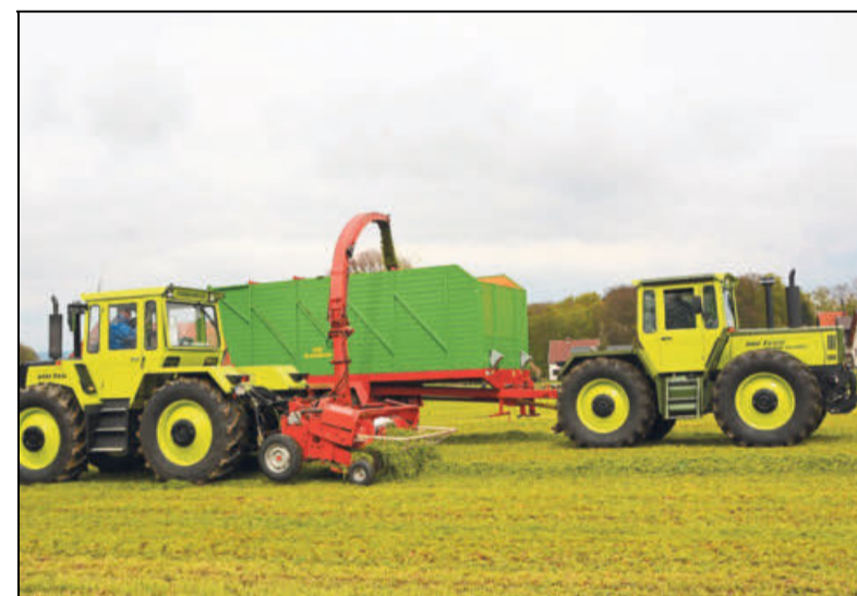
Am Veranstaltungstag wird es Feldbearbeitungen geben, bei denen die Besucher den Fahrern zusehen dürfen.