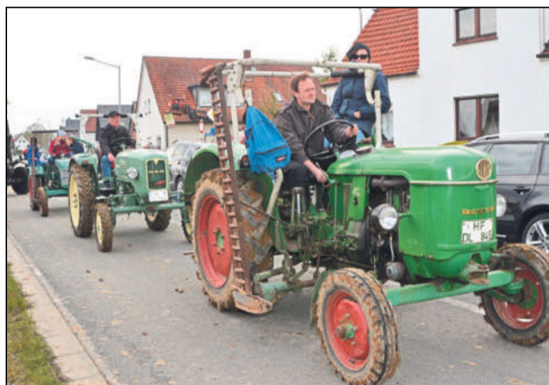
Die Corso-Fahrt durch den Ort wird wie bereits vor zwei Jahren auch dieses Mal ein Höhepunkt der Veranstaltung sein.

Insgesamt startet die Veranstaltung an beiden Tagen um 10 Uhr, der Bauernmarkt endet um etwa 18 Uhr.